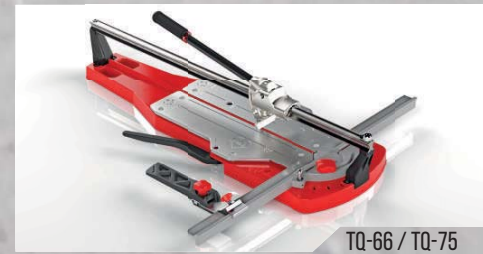
TQ-66 / TQ-75